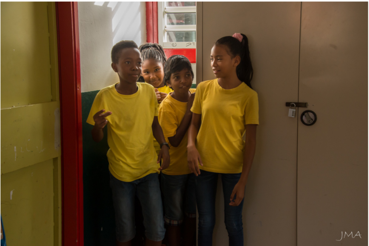
Photographies réalisées par Jean-Michel Arthaud lors d'une séance avec les 6H